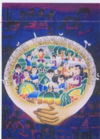
ชื่อภาพ "รักอนามัย ปลอดภัยโรคลมชัก" ด.ญ.จารุณี พาระมิ อายุ 11 ปี ชั้นประถมศึกษาปีที่ 5 โรงเรียนวัดท่าพระ

รางวัลที่ 3 : ได้รับเงินรางวัล 2,000 บาท พร้อมประกาศนียบัตร จำนวน 2 รางวัล ได้แก่