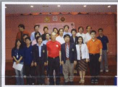
คณะกรรมการชมรมโรคลมชักเพื่อประชาชนและทีมงานจัดบรรยายความรู้สำหรับประชาชนครั้งที่ 8