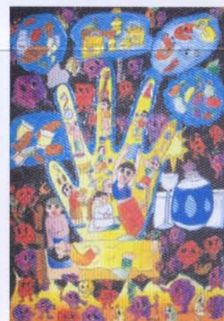
ชื่อภาพ "มือผู้ปกป้อง" ด.ญ.ศิลาภรณ์ จันทูมา อายุ 10 ปี โรงเรียนวัดสะพาน