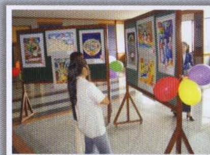
นิทรรศการแสดงผลงานภาพวาดที่ชนะการประกวด