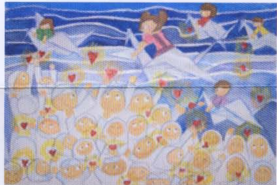
ชื่อภาพ "ส่งหัวใจให้ชาวใต้" ด.ญ.พรปวีณ์ สมศิริวัฒนา อายุ 10 ปี ชั้นประถมศึกษาปีที่ 4 โรงเรียน มาแตร์เดอีวิทยาลัย

รางวัลที่ 2 : ได้รับเงินรางวัล 3,000 บาท พร้อมประกาศนียบัตร จำนวน 1 รางวัล ได้แก่